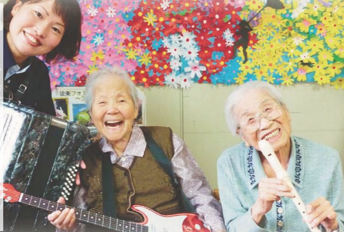
「笑いの音色」 後楽デイサービスセンター(倉敷市)

この度、岡山県老人福祉施設協議会(以下、岡山県老協)で情報誌「B-K!」(ぼっけえ)を発行することになりました。岡山県老協の情報や各施設の情報、動いている職員、意外な趣味活動などを取り上げ、皆さんにお伝えしていきたいと考えております。ぜひ、ご覧ください。